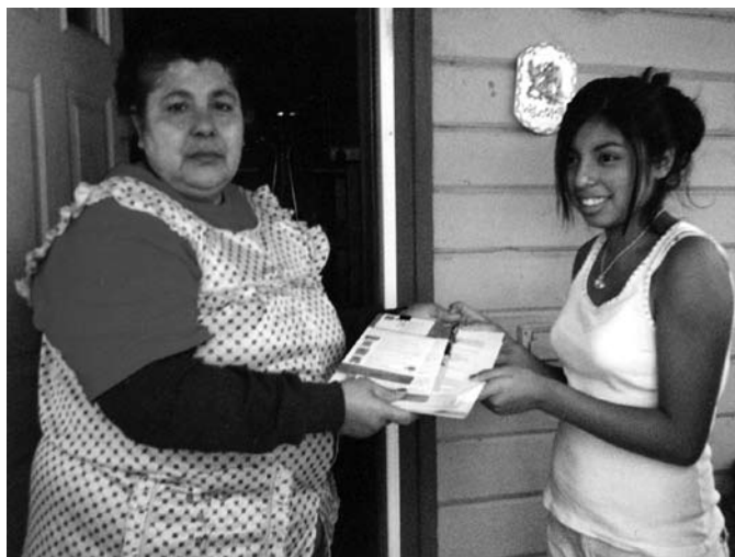
Members of the Wenatchee Women's Justice Circle distributed their health information pamphlets door-to-door in Spanish-speaking households.

“If we've helped one woman get an exam, we've made life better for her and her family..Going out to meet women opened my eyes to do more in the community, We're ready!”