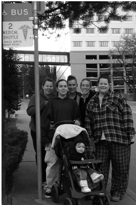
Spokane St. Margaret's Shelter Women's Justice Circle participants at new bus stop.

Margaret's, it also represents a far more significant accomplishment. The women raised their voices to a powerful community institution. The Spokane women gained first-hand experience of a small group of concerned citizens making a difference, even if those citizens happen to be homeless. The sense of empowerment was invaluable to the women of St. Margaret's.