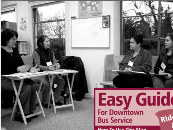
Cristo Rey Justice Circle discussing their housing fair details.