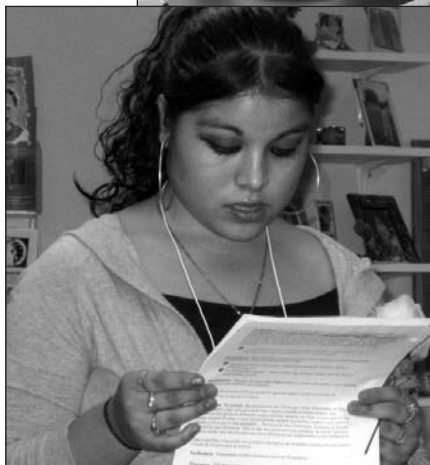
Top: The leadership team of the Quincy Women’s Justice Circle planning to take action on the issue of teen pregnancy. Bottom: Circle facilitator leading participants through the process for change.

embarazo de jóvenes. Los jóvenes están organizando la comunidad para reducir el número de embarazos en las jóvenes. Para lograr esto, están reuniendo a los padres de familia y los jóvenes para el diálogo, la educación