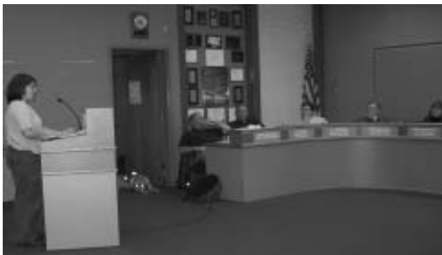
Justice Circle participants testify before the InterCity Transit Authority.

Everett—Change is possible! The proposed changes to Everett Transit Route 19 in the Silver Lake/Eastmont area recommended by WJC participants will be presented for approval at the June Transit Board meeting. The Circle at the Family Tree Apartments, an Intercommunity Mercy Housing property, began in the Fall of 2004. We are hopeful that results will mean adequate transit service to the Silver Lake area.