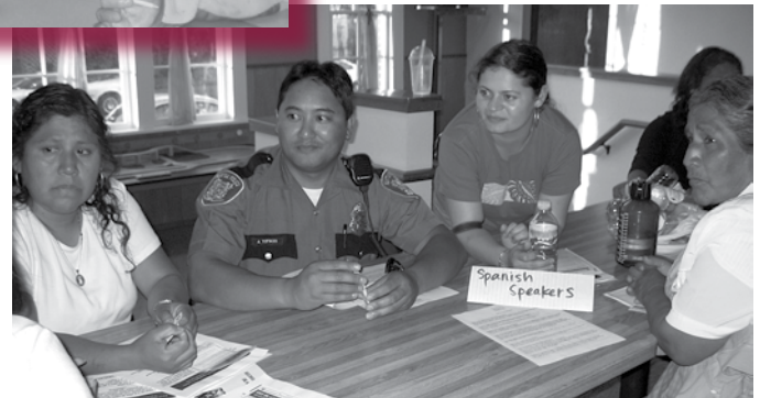
Burien Justice Circle participants voice their concerns about neighborhood crime at “Weed & Seed.”

sacadas en el conteo de un día de la gente que duerme en la calle en el condado de Skagit, el conejal John Cheney verificó que las estadísticas estaban correctas y les agradeció a las mujeres por recordar al consejo de la importancia del asunto de los que no tienen vivienda. En otras cartas, las mujeres le pidieron al alcalde Bud Norris que proveyera los detalles específicos de su plan para mejorar esa