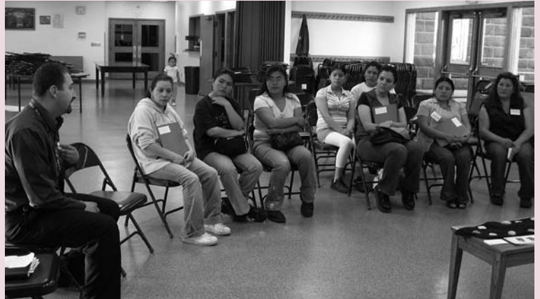
Participants talk to the Parent Coordinator for the Yakima school district about their concerns.

Los Círculos de Monroe, Yakima y Sunnyside están unidos en sus esfuerzos para disminuir la discriminación y crear ambientes positivos y saludables para el aprendizaje en sus escuelas. En Sunnyside el distrito escolar ahora consulta a las líderes del Círculo de Justicia para sus consejos. Se están formando nuevas relaciones con el personal del distrito en Monroe y Yakima.