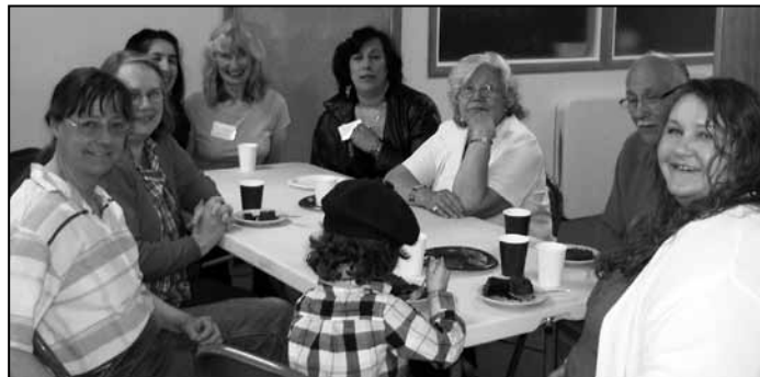
Justice Circle participants with members of the Okanogan County Literacy Council.

O mak—El Círculo de Mujeres para la Justicia de Omak-Okanogan ha avanzado enormemente en la alfabeti-