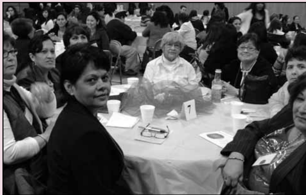
Mujeres poderosas que asistieron a ¡Latinas Conectadas para el Cambio!

S unnyside—“ Pero sigo siendo la reina ”. La primera conferencia Justicia para la Mujer: ¡Latinas Conectadas para el Cambio! acabó con estas palabras cantadas con pasión por las par-