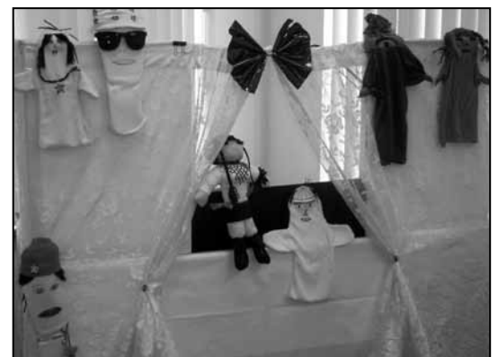
Facilitators designed puppets, scenery and wrote the script for the puppet show.

Facilitators featured a puppetry performance to dramatize how abusive patterns can be learned by children and repeated later in life. The child in their story, who witnessed abuse at home, becomes an abuser as a teenager and is jailed when his partner reports him to the police. His arrest leads the family to have a dialogue about domestic violence. The show, put