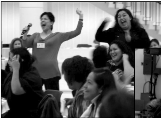
Cathartic cry of liberation!

Las participantes se mostraron agradecidas por tener un espacio seguro para compartir sus experiencias, "Me gustó mucho que en esta conferencia estuvimos en un lugar a salvo para compartir y hablar nuestra verdad en español." La conferencia fortaleció su sentido de pertenencia "Estar aquí me hace sentir que pertenezco. Nuestra hermandad me da el valor que necesito para seguir adelante. Las participantes se liberaron al reconocer sus logros, reclamaron su potencial como líderes y declararon que querían unirse a otras Latinas para crear un movimiento más notorio, "Estoy aquí porque tenemos que tener un liderazgo más visible en la comunidad Latina. Si lo hacemos, nuestra comunidad será más fuerte, más sensible y dispuesta a resolver los problemas que enfrentamos." La necesidad de conectarse con otras líderes cotidianas y recuperar la esperanza de un futuro mejor se satisfizo, "Reafirmo mi convicción de continuar apoyando a mi comunidad. Hoy he descubierto que no soy la única, muchas mujeres comparten mis sueños ¡Juntas podemos hacer más! "