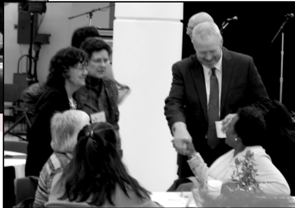
Seattle Mayor McGinn greeting conference participants.

Participants were grateful for a safe space to open up and share their experiences, "I really liked that at this conference we were in a safe place to share and speak our truth in Spanish." The conference strengthened their sense of belonging, "Being here, makes me feel that I belong.