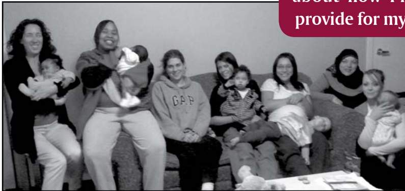
Harrington House mothers courageously advocate for their children's right to secure housing.

Circle participants wrote a joint letter to their legislators, accompanied by separate individual personal testimonials, with the hope of making an impact for all who are in their large community of struggling women with children. They found the courage to write these stories when they realized they were not alone. The Justice Circle built and strengthened a community, giving them courage to speak. This courage will not end with their Circle. Some women plan to attend an upcoming Advocacy Day in Olympia. Others engage their friends and family in conversation. Voices, raised together for social change, continue to be spoken and heard.