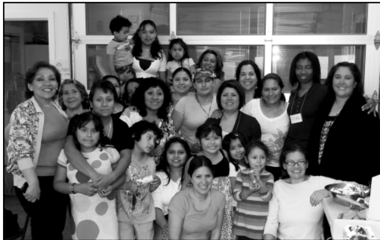
Mujeres Sin Fronteras strive to dignify domestic workers' rights.

¡Felicitaciones a todas las coordinadoras de Justicia para las Mujeres, colaboradores, facilitadoras y participantes que han trabajado juntas por más de doce años para desarrollar nuestros Círculos de Mujeres para la Justicia! Seguimos dando la bienvenida a toda oportunidad de colaboración para iniciar nuevos Círculos y así mejorar las condiciones de vida de mujeres marginadas.