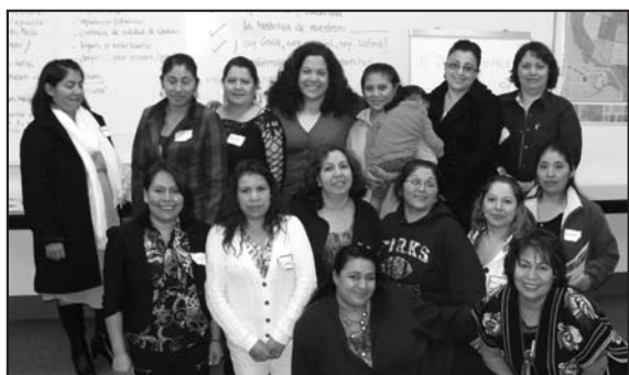
Forks Hispanic Family Association leaders with JFW Coordinator.

F orks—The Justice for Women Coordinator trained powerful leaders from Forks Hispanic Family Association at Peninsula College’s satellite campus in Forks. Participants found their inner strength through recognizing their identity, their strengths, their commitments, their priorities for their community and the leadership steps that lie in front of them.