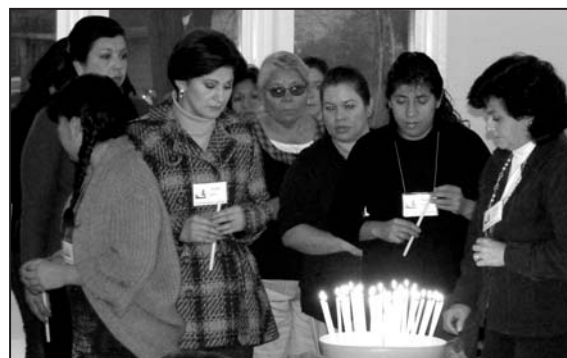
Leaders reclaimed their light in community.