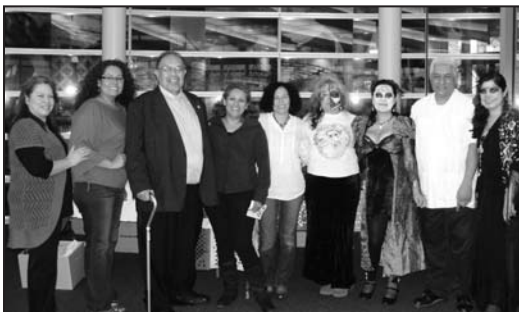
Latino City Employees donated funds to help domestic violence survivors in detention.

“Exijo que todas las mujeres privadas de libertad sean tratadas con humanidad, dignidad y respeto.”