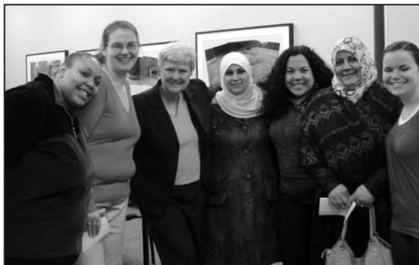
Appian Way Justice Circle participants met with Senator Keiser

El Círculo de Mujeres de Appian Way abordó el tema de la vivienda de transición y las penurias que el “límite de dos años” sostiene sobre sus cabezas. El Círculo escribió cartas a sus legisladores. La senadora Keiser las invitó a reunirse con ella. “Yo quedé tan conmovida por su carta que no me pude resistir a encontrar una oportunidad de conocerlas a todas. Sus testimonios están llenos de energía, resiliencia y esperanza. ¡Así se hace!” exclamó la senadora mientras daba una cálida bienvenida a las participantes del Círculo.