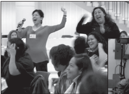
Cathartic cry of liberation!

Las participantes se mostraron agradecidas por tener un espacio seguro para compartir sus experiencias, "Me gustó mucho que en esta conferencia estuvimos en un lugar a salvo para compartir y hablar nuestra verdad en español." La conferencia fortaleció su sentido de pertenencia "Estar aquí me hace sentir que pertenezco. Nuestra hermandad me da el valor que necesito para seguir adelante. Las participantes se liberaron al reconocer sus logros, reclamaron su potencial como líderes y declararon que querían unirse a otras Latinas para crear un movimiento más notorio, "Estoy aquí porque tenemos que tener un liderazgo más visible en la comunidad Latina. Si lo hacemos, nuestra comunidad será más fuerte, más sensible y dispuesta a resolver los problemas que enfrentamos." La necesidad de conectarse con otras líderes cotidianas y recuperar la esperanza de un futuro mejor se satisfizo, "Reafirmo mi convicción de continuar apoyando a mi comunidad. Hoy he descubierto que no soy la única, muchas mujeres comparten mis sueños ¡Juntas podemos hacer más!"