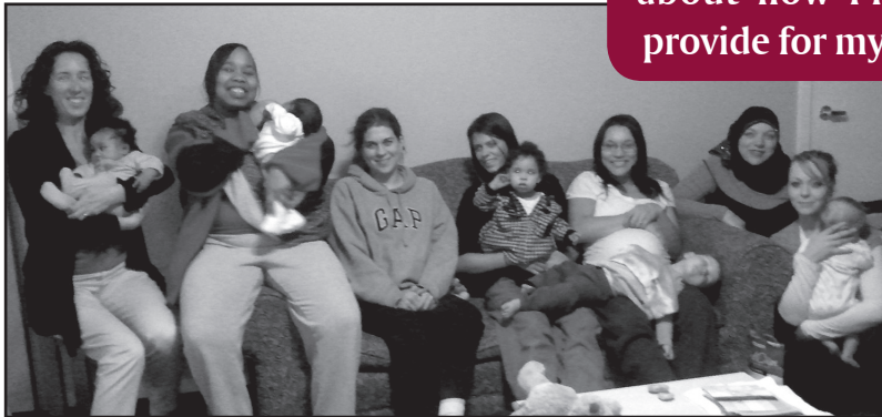
Harrington House mothers courageously advocate for their children's right to secure housing.

Circle participants wrote a joint letter to their legislators, accompanied by separate individual personal testimonials, with the hope of making an impact for all who are in their large community of struggling women with children. They found the courage to write these stories when they realized they were not alone. The Justice Circle built and strengthened a community, giving them courage to speak. This courage will not end with their Circle. Some women plan to attend an upcoming Advocacy Day in Olympia. Others engage their friends and family in conversation. Voices, raised together for social change, continue to be spoken and heard.