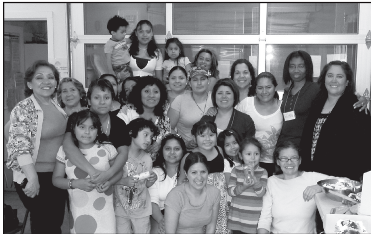
Mujeres Sin Fronteras strive to dignify domestic workers' rights.

¡Felicitaciones a todas las coordinadoras de Justicia para las Mujeres, colaboradores, facilitadoras y participantes que han trabajado juntas por más de doce años para desarrollar nuestros Círculos de Mujeres para la Justicia! Seguimos dando la bienvenida a toda oportunidad de colaboración para iniciar nuevos Círculos y así mejorar las condiciones de vida de mujeres marginadas.