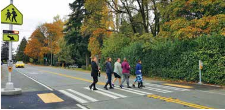
Circle leaders inaugurate their new crosswalk

Burien, WA –Hace algún tiempo, un grupo de madres latinas que viven en los Apartamentos Woodridge expresaron su preocupación sobre la seguridad peatonal en un peligroso cruce