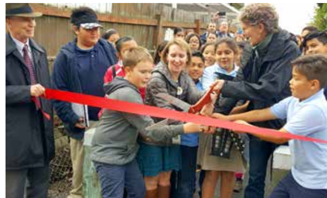
The Burien community is thrilled at the ribbon-cutting ceremony

Three years later, IPJC attended the ribbon cutting ceremony of the Hilltop Elementary ADA accessible sidewalk and the Solar Rectangular Rapid Flashing Beacon (RRFB) Project! We could not be more proud of the courageous women who started it all!