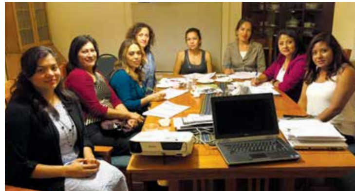
Catherine Place Circle participants gather to organize for action

Circle participants provided other Latinas in their community with an opportunity to become knowledgeable potential home buyers.