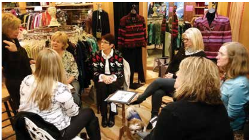
PurSuits-Clothing Women in Confidence leaders meet with Renaissance owner

Clinton, IA – Clinton, Iowa has a poverty rate of 22%. Even though numerous people are looking for work, many people in the community lack the re-